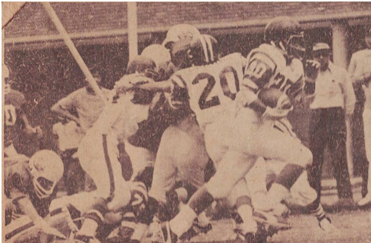
Club Cobras, año 1972.