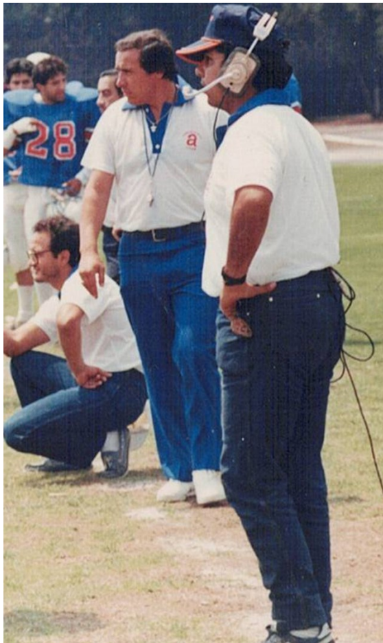
Coach Águilas Reales (liga mayor), año 1988.