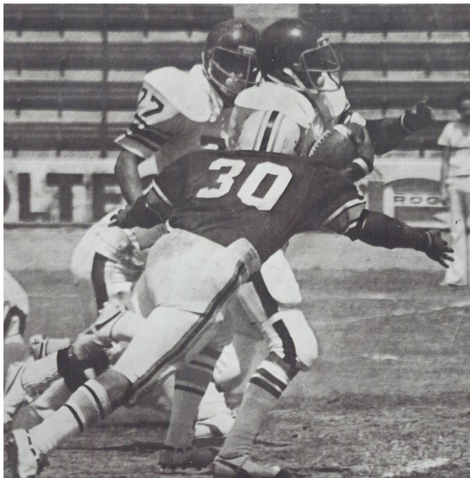
Prepa 9, jugador #30 (intermedia), año 1977.