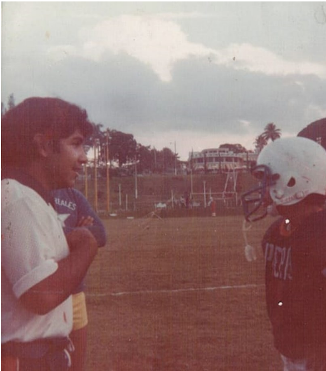
Coach Prepa 9 (infantil A), año 1980.