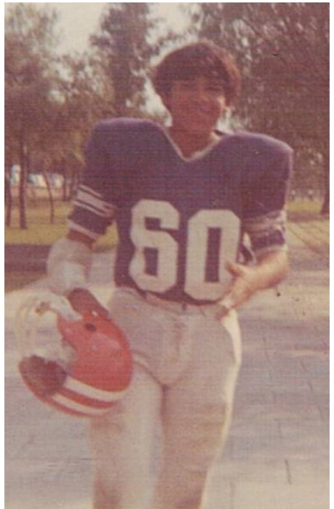
Club Cobras, año 1972.

Diseñó y coordinó el Torneo Interfacultades de FBA durante 15 años, así como los torneos de Futbol bandera que en si momento llegaron a contar con 120 equipos de las ramas femenil y varonil.