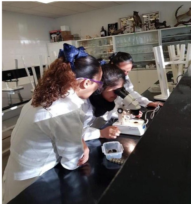
Figura 2. Observación de muestras de musgo en el microscopio estereoscópico.